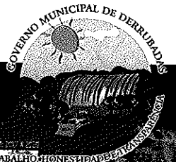
Alair Cemin Prefeito de Derrubadas

Com base nisso, amparados na Lei Orgânica Municipal e a Lei Municipal nº 489/03, que contemplam e autorizam a concessão e/ou permissão de uso dos equipamentos do Poder Público, mediante o incentivo à produção e aos resultados buscados, encaminhamos a presente matéria ao Legislativo para fins de apreciação e aprovação, o qual virá ao interesse da população local.